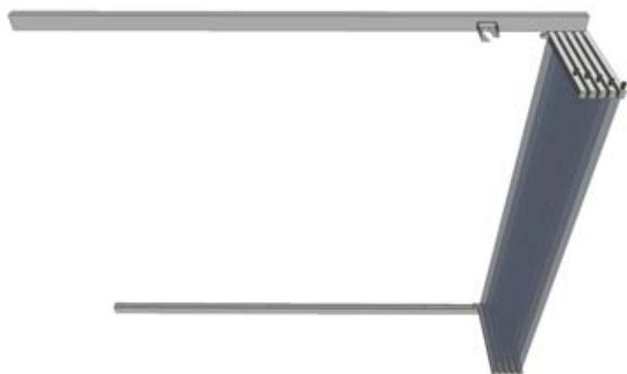
Sistema completamente abierto | Completely opened system