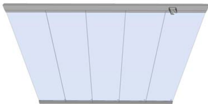
Sistema completamente cerrado | Completely closed system